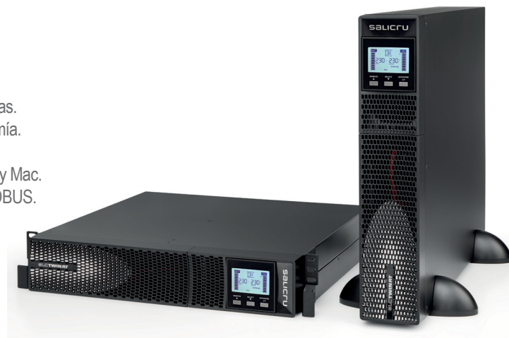
SLC TWIN RT2